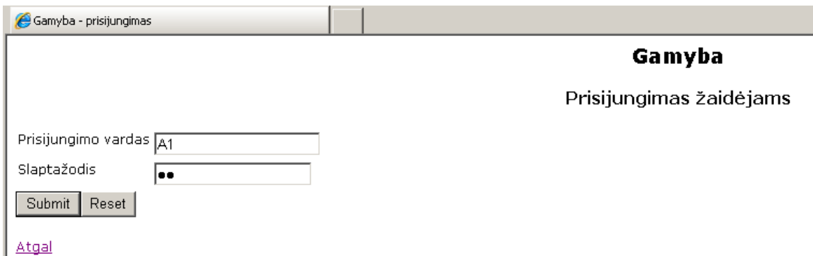
2 pav. Studento prisijungimas

Prisijungus žaidėjui (studentui) jam suteiktu vardu jis gauna 2 paveiksle pateiktą vaizdą.